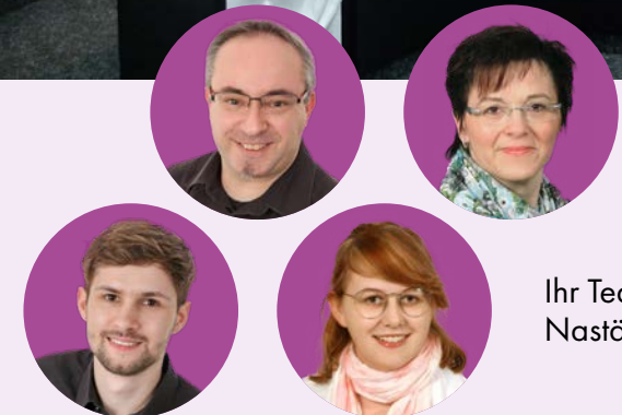
Ihr Team in Nastätten