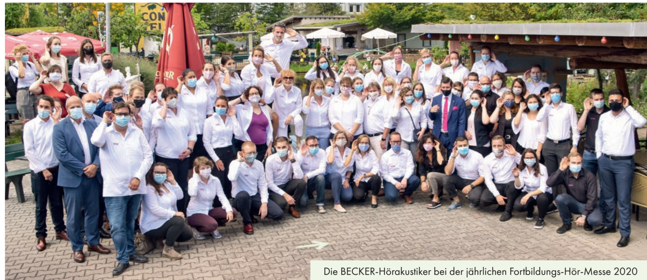
Die BECKER-Hörakustiker bei der jährlichen Fortbildungs-Hör-Messe 2020

„Menschen mit Hörproblemen und moderne Hörgerätekunstik so miteinander zu verbinden, dass deren Alltag durch gutes Hören und Verstehen wieder leichter wird,