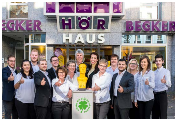
Ihr BECKER-Team in Koblenz

Die Teilnahmebedingungen finden Sie auf www.beckerhoerakustik.de